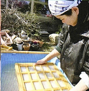
東京都 | 東京戸倉和紙